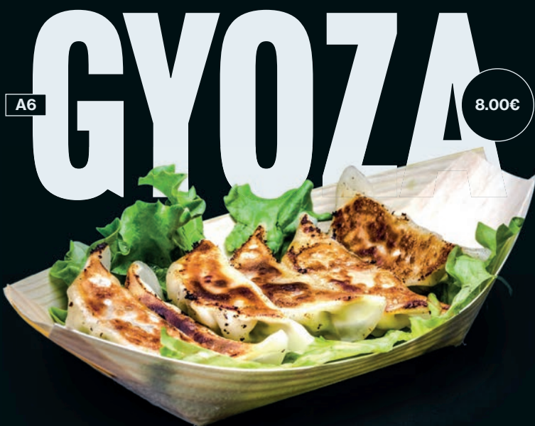
Raviolis grillés au poulet et aux légumes - 6 pièces.

Des recettes pleines de fraîcheur pour débiter ou accompagner votre repas.