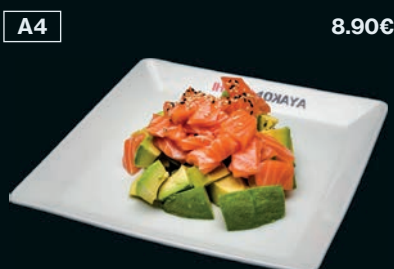
Salade saumon avocat