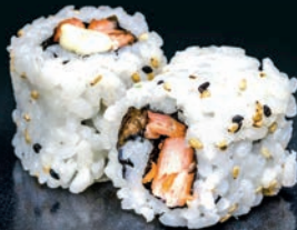
Saumon cuit & mayonnaise