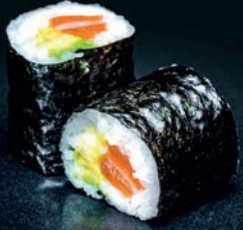
Saumon & avocat