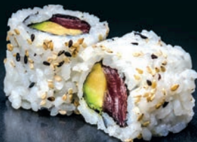
Thon & avocat