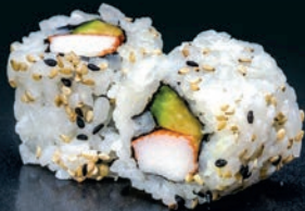
Surimi & avocat