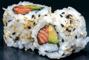
Saumon & avocat