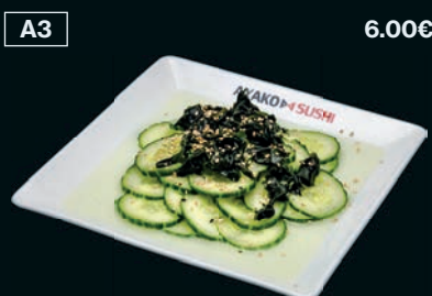
Salade de concombres aux algues