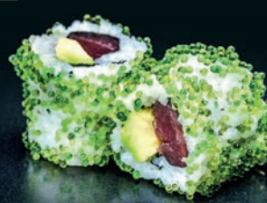
Wasabi thon & avocat