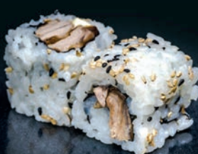
Thon cuit & mayonnaise