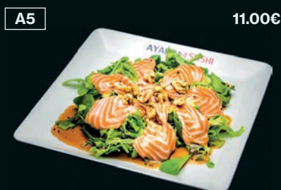
Salade maison Noix & saumon