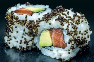
Noir saumon & avocat