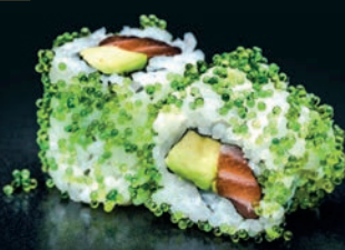
Wasabi saumon & avocat