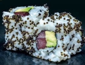
Noir thon & avocat