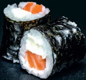
Saumon & cheese