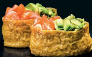
Inari saumon & avocat