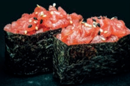
Tartare de thon