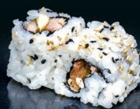
Poulet cuit & mayonnaise