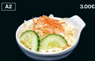
Salade de chou Concombre & carotte