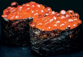
Œufs de saumon