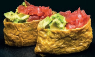
Inari thon & avocat