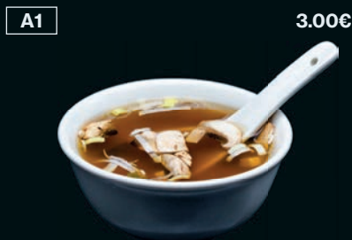
Soupe miso aux 5 épices