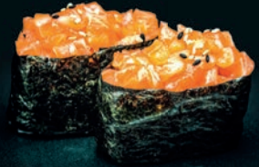
Tartare de saumon